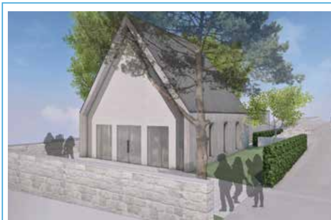
Der Alternativvorschlag für die Gestaltung der Aussegnungshalle. Entwurf: Planungsbüro Grassl