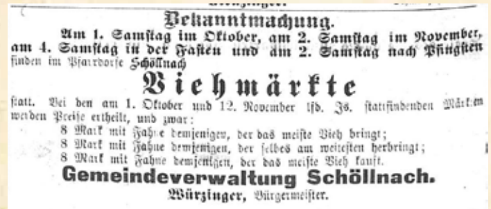
Schöllnach etwa im Jahr 1895

Lager aufstellten und mit Steinen aufeinander warfen. Auch hier wurde vom Messer Gebrauch gemacht, indem ein Tagelöhner drei nicht lebensgefährliche Stiche erhielt. Es ist schrecklich, wie die Rohheit und Ausgelassenheit in unserer Zeit zunimmt und namentlich werden kirchliche Feste durch solche schändliche Flegeleien entheiligt.