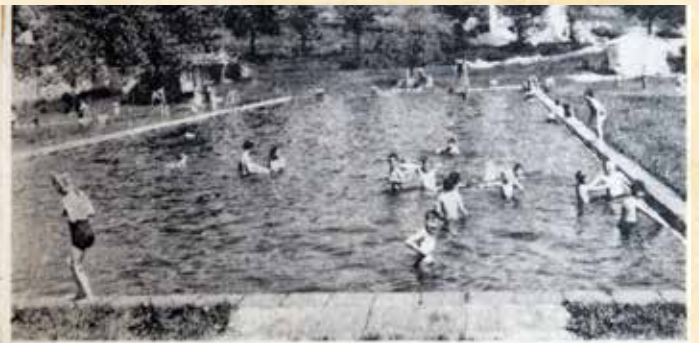
Der Markt ladet freundlich zum Bade