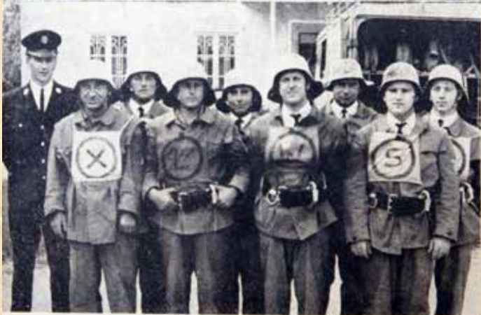
Den Ausbildungsstand weiter verbessert