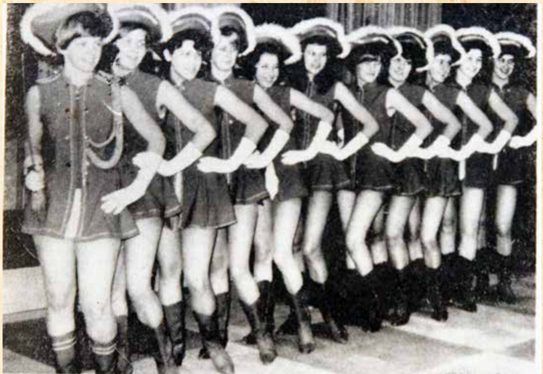
Fesche Garde auf die Beine gestellt

Beim Sportverein wird das Aufstiegsthema wieder aktuell. Die Mannschaft hat sich durch die Herbstmeisterschaft eine gute Ausgangsposition für die Rückrunde geschaffen. Wenn sie sich so tapfer schlägt und wenn neben der Kondition in Zukunft auch auf die taktische Einstellung geachtet wird, dann müßte es heuer klappen. Trainer Klimm will sich seinen Bart erst wieder abnehmen lassen, wenn der Aufstieg geschafft ist. Er hat damit begonnen, seine Schützlinge fit zu bekommen.